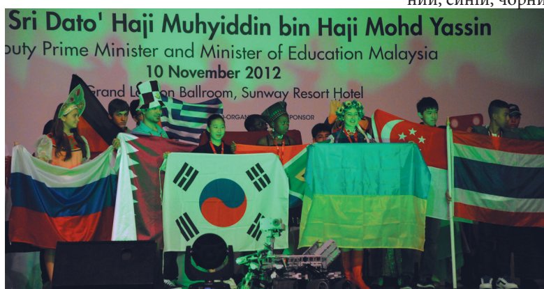
Sri Dato' Haji Muhyiddin bin Haji Mohd Yassin Deputy Prime Minister and Minister of Education Malaysia 10 November 2012 Grand Ballroom, Sunway Resort Hotel

Олімпіада проводиться у трьох категоріях: