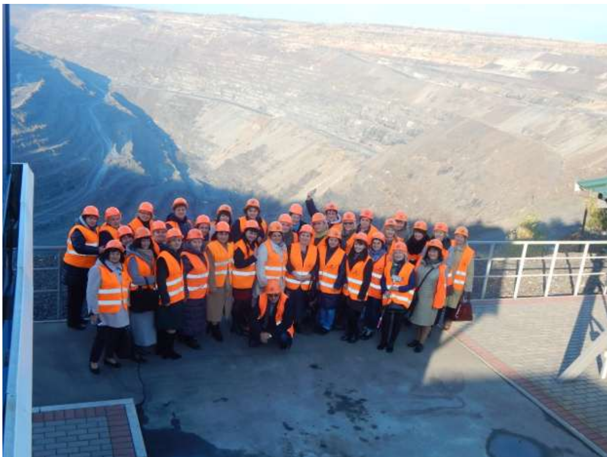
Автор: Яценко Т.В.