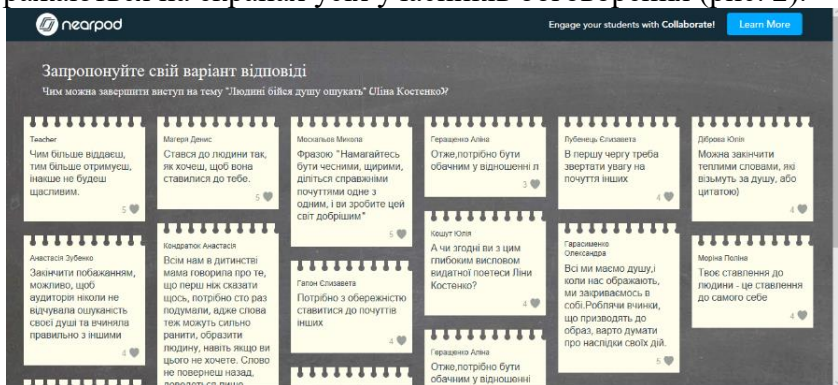
Рис. 2. Дошка обговорень «Чим можна завершити виступ на тему “Людині бійся душу ошукать”?»

Результати, отримані учнями під час відповіді на запитання тестів, автоматично оцінюються та відображаються на екрані учителя – поіменно по кожному учню та узагальнено у вигляді діаграми стосовно всього класу. Відповіді на запитання відкритої форми можуть відображатися не лише в учителя, а й передаватися на екрани учнів для спільного обговорення правильності відповіді або цікавої думки. Мозковий штурм може супроводжуватись розміщенням повідомлень від учнів на стікер-борді, які одночасно відображаються на екранах усіх учасників обговорення (рис. 2).